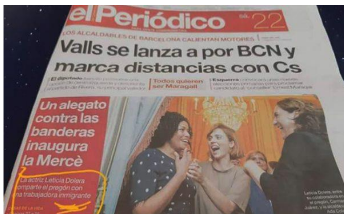
* El Periódico

El butlletí d'El Periódico del 27 de setembre, conté alguna notícia a considerar com a Bones Pràctiques : Mireu la newsletter .