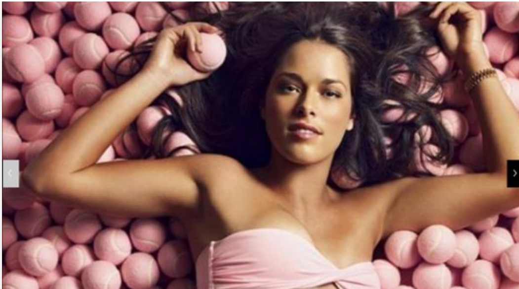
A les seccions d'esports , moltes vegades s'utilitza imatges de dones per atreure als lectors.

En la web general també destaquen les imatges femenines.