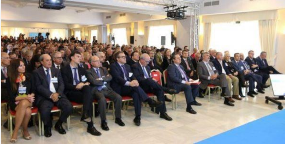
Ningú mitjà s'ha cuestionat aquesta foto sense dones, de la Reunió del Corredor Mediterrani,