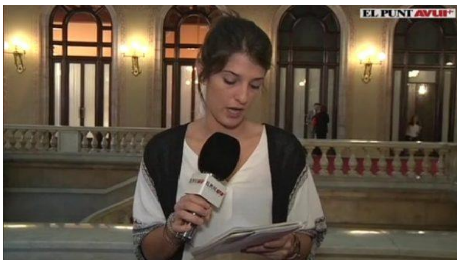
A les televisions

Com a Bones Pràctiques , destaca la foto en aquest article de Societat amb més de la meitat de dones: "El Clínic acosta la immunoteràpia a diferents tumors", encara que en el llenguatge segueixen parlant solament d'investigadors homes...[ +info ]